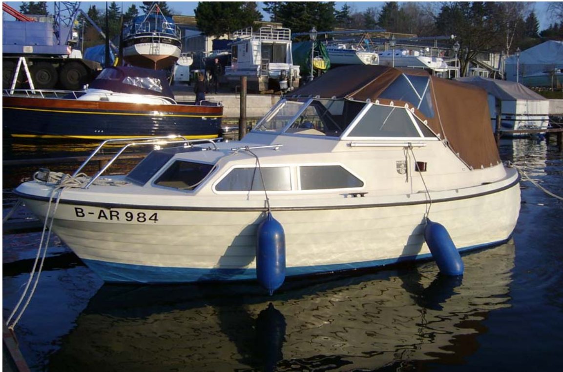
Länge: 6,5 m Breite: 2,4 m

Unsere kleinste Motoryacht. Wunderbar geeignet als Einsteigerschiff für 2 Personen mit kleinem Geldbeutel.